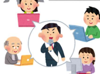
仕組まれた政治判断