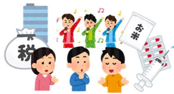
仕組まれた世論・SNS

この構図のことをSDICS（エスディクス）と言います。詳しくは https://sdics.net