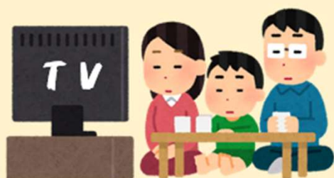
（２）意図された情報を得る