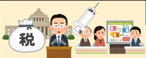
（１）意図を持った配信