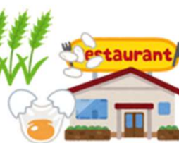
左右されるインフラ、農業、食品